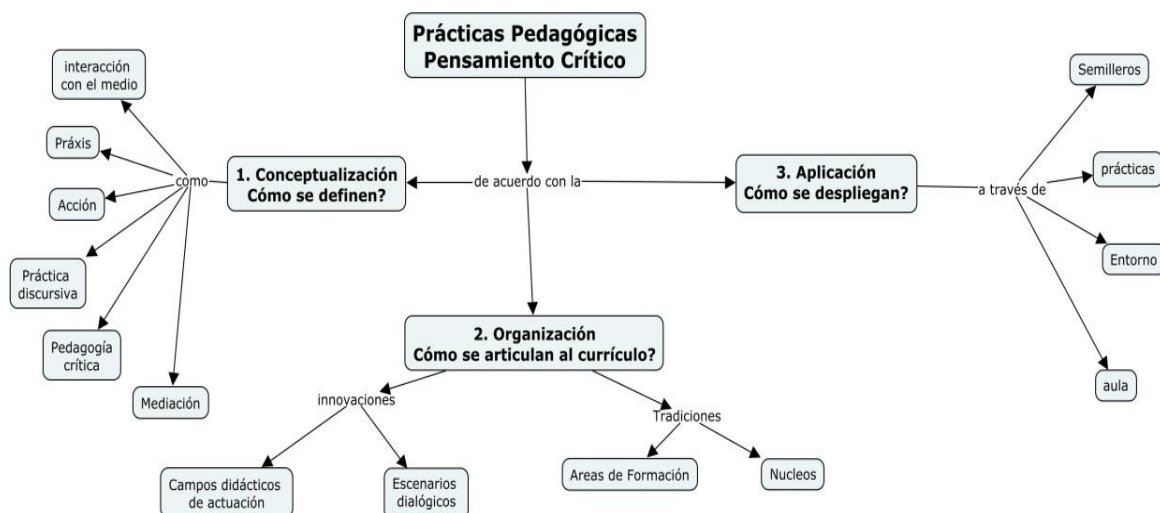
Esquema N° 2: Práctica Pedagógica para el pensamiento crítico